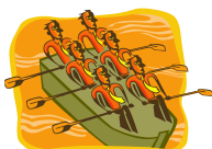
Horaires aménagés pour sportifs